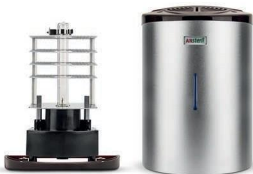
AS10 // AS10X