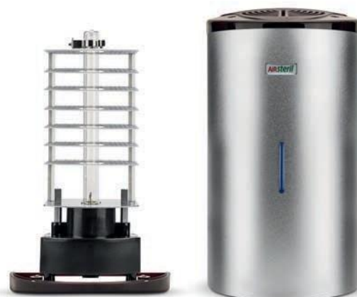
AS20 // AS20X // AS20M